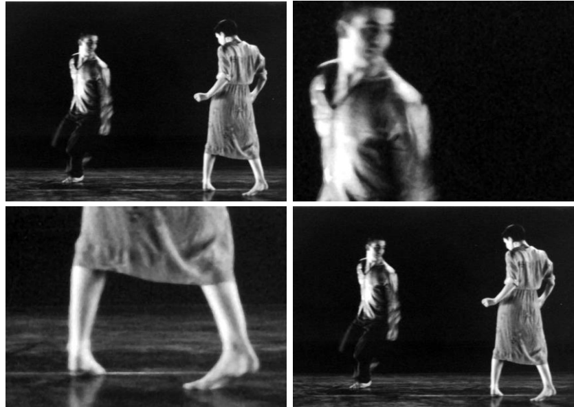
PAPOTAGES en 2000

« Le spectacle jeune public : Histoire et esthétiques », ed. La Scène